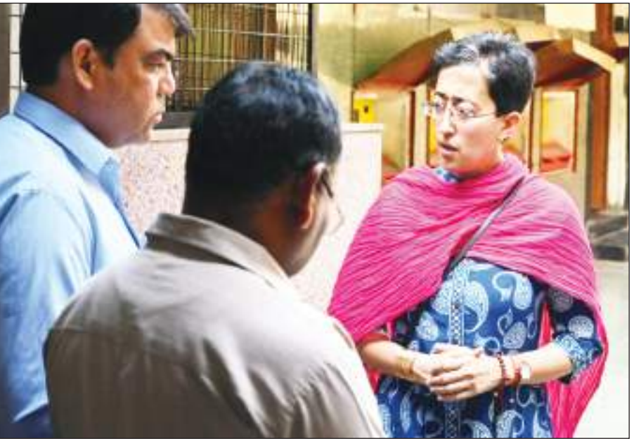
लाजपत नगर चाइल्ड केयर होम में कमियाँ पाने पर महिला एवं बाल विकास मंत्री आतिशी ने अधिकारियों को लगाई फटकार, कहा बच्चों के मामले में लापरवाही नहीं होगी बर्दाश्त।

नई दिल्ली। पर्यटन मंत्रालय मन की बात की 100वीं कड़ी के मौके पर युवा पर्यटन क्लबों के माध्यम से 'मन की बात की 100 कड़ी - 100 दिनों की कार्रवाई' की एक विशेष पहल शुरू करने जा रहा है। इसके साथ युवा पर्यटन क्लबों में रविवार को 'मन की बात' की 100वीं कड़ी का प्रसारण किया जाएगा। प्रधानमंत्री नरेन्द्र मोदी द्वारा समय-समय पर 'मन की बात' में पर्यटन का उल्लेख किया गया है।