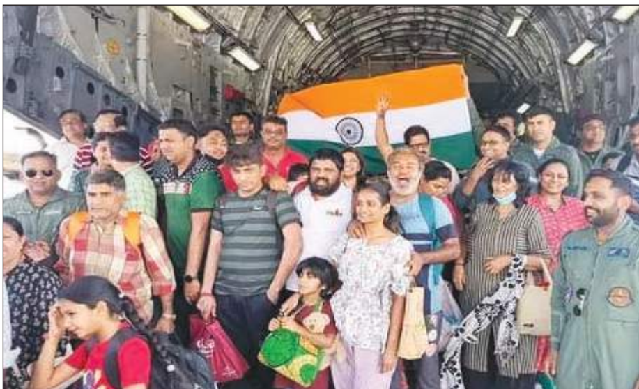
ऑपरेशन कावेरी के तहत सूडान से 365 भारतीय दिल्ली लौटे।

दिया था: प्रधानमंत्री ने 2014 का वाक्या याद करते हुए कहा कि ये मेरा सौभाग्य है कि इस विधानसभा चुनाव में मेरी शुरुआत बीदर से हो रही है। बीदर का आशीर्वाद मुझे तब भी मिला था जब मैं प्रधानमंत्री पद का उम्मीदवार बना था। आज इतनी बड़ी संख्या में यहाँ आ कर आपने पूरे देश को संदेश दे दिया है कि इस बार, भाजपा सरकार। यह चुनाव कर्नाटक को देश में नंबर-1 राज्य बनाने का चुनाव है। पीएम ने कहा कि कर्नाटक को देश का नंबर-1 राज्य बनाने के लिए यहाँ डबल इंजन सरकार का होना बेहद जरूरी है।